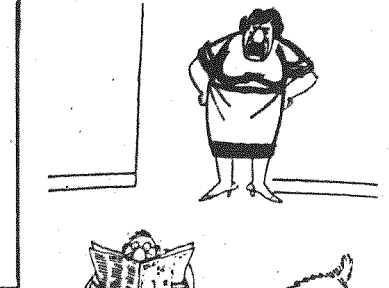
Przeistniał mówić „jak kochana” na każdym razem gdy pies zaszeceka.