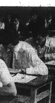
Gorące i w szalch egzaminie czynnych, i na zewnątrz...