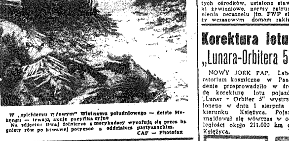
W „spichlerzu” żołnierzy Wietnamu południowego - dzieje Mekongu. Na zdjęciu: Dwa żołnierze amerykańscy wyciągają się przez barierę z krową potężną z oddziałem.

Zaloga opuściła w panice pozostawiając za sobą morze. W wyniku ataku partyzantów zostały także okręty amerykańskie zakotwiczone przy molo. Jednostka ta zaczęła tonąć