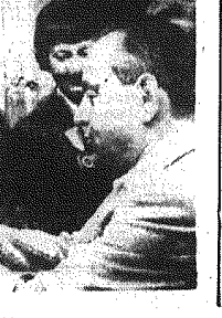
W wyniku pożaru w Rio de Janeiro

Opisuje plewonośników szedli dwu jezior turawskich. Pion ich pokazywał był obity. Wyłowiono m. in. dwa tranzytorowe radiolodniarki, plecak z kompletnym wyposażeniem turystycznym, walizkę z gariturem i kocznią noniron, dwa zegarki na reke, przedmiot 19 tyś. złotych, kostki piasku, 16 kłosek oraz górna szufla szufla. W czasie plewonośniczych wycieczek na dnie jezior 117 tonik różnego rodzaju przedmiotów.