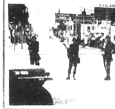
Na zdjęciu: oddziały policji i wojska patrolują ulice miasta Milwaukee

LONDYN PAP. Korespondenci TASS i Reuters informują, że wojska rządowe w Kongu-Kinszasie wyparły blachy najemników i zbuntowanych byłych żołnierzy Katandi z dwóch miast - Puna oraz Lubutu (we wschodniej prowincji Kiwu) po zwycięstwach walcach. Radiostacja rządowa odzyskała tę władzę, stwierdzając, że uciekinierzy niemający usiłują dotrzeć do jeziora Kiwu, na granicy Rwandy.