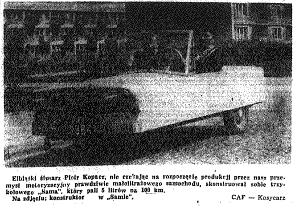
Bliski współpracownik Piłk Kopacz, nie czyniący na rozporządzenie produkcji przez nasz przemysł motoryzacyjny prawdziwie małodrozdowego samochodu, skonstruował sobie trykotowego „Samca”, który pali 5 litrów na 100 km. Na zdjęciu: konstruktor w „Samcu”.