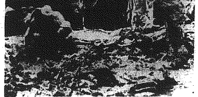
Oto wrak jednego z samolotów USA zestrzelonych nad Hanoi.

Radio podało, że dwuosobowy samolot został zatrzymany przez władze, gdy wylądował w Hassi Messaoud około 60 km na południe od Algieru. Członkowie załogi stanę przed sądem.