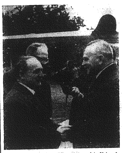
Na zaproszenie Sejmu PRL przybyła w dniu 28 bm. do Warszawy delegacja Czechosłowackiego Zgromadzenia Narodowego. Na zdjęciu: Wycech wita na Okęcie przewodniczącego parlamentu CSRS, Bohuslava Lasztoveczka, który stoi na czele delegacji.

LONDYN PAP. Lotnictwo amerykańskie kontynuuje zbrodnicze naloty na Demokratyczną Republikę Wietnamu. Głównym obiektem ataków były magazyny i inne zabudowania w Hon Gay — trzecim co do znaczenia porcie Demokratycznej Republiki Wietnamu po Hajfongu i Cam Pha. Jak oświadczył w czwartek rano w Saigonie rzecznik woj skowy USA, w środę w pobliżu Hanoi doszło do czterech bitew powietrznych między 55 samolotami północnowietnamskimi a amerykańskimi. Rzecznik przyznał, że ani jeden samolot północnowietnamski nie został trafiony. Północnowietnamskie „MiG-17” zaatakowały amerykańskie maszyny typu „Thunderchief”, kiedy próbowały one bombardować obszar położony w odległości 45 km na północny wschód od stolicy DRW. Piraci amerykańscy bombardowali w środę mosty, drogi i osiedla w odległości ponad 100 km od Hanoi. Samoloty startujące z lotniskowców zaatakowały linie kolejową w pobliżu Nam Dinh, 57 km na południe od Hanoi. Bombardowano także pobliskie rejony Wietnamu północnego.