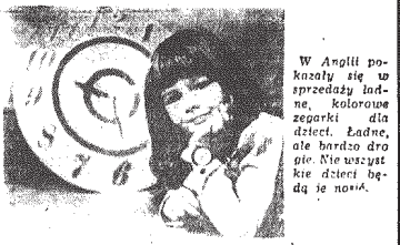
W Anglii pokazywały się w sprzedaży ładne, kolorowe zegarki dla dzieci. Ładne, ale bardzo drogie. Nie wystarczyć im pieniędzy, by kupić taki zegarek.