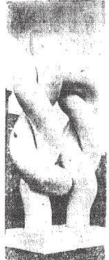
„Wzrętek babuni” — rzeczą.