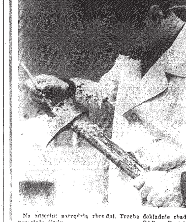
Na zdjęciu nadzorca zbrodni. Trzeba dokładnie zbadać przestępstwa.