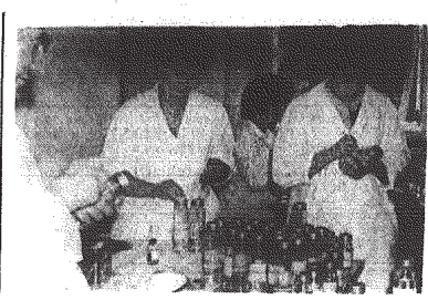
W ogromnym skupieniu personel stacji przygotowuje akceptację.

W 1928 r. nadziedzi kryzys gospodarczy. Huta walczyła o przetrwanie. Władze państwa powinny zadbać o to, aby huta, która jest typowa dla naszego kraju, miała szansę na przetrwanie. W tym celu należy wyznaczyć odpowiednie miejsca i wybudować odpowiednie budynki.