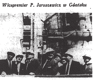
Wicepremier P. Jakszewicz w Gdańsku

PRZED W ZJAZDEM PZPR Pomyślna realizacja zobowiązań w przedsiębiorstwach budownictwa drogowego i transporcie Kieleczyzny Ponad 20 mln zł osiągnęła wartość zobowiązań, jakie dla uczczenia V Zjazdu partii podjęły załogi przedsiębiorstw budownictwa drogowego i transportowego Kieleczyzny. Między innymi w Państwowej Komunikacji Samochodowej wykonano już zobowiązania wartości 17 mln 800 tys. zł. W przedsiębiorstwach podległych Wojewódzkiemu Zarządowi Dróg Publicznych trwa realizacja zobowiązań wartości 3 mln 200 tys. zł, a w Kieleckim Przedsiębiorstwie Robot Motorycznych wartość 2 mln 257 tys. zł. Skaniny z Kieleckich Kamieniołomów Drogowych wykonał już zobowiązania produkcyjne wartości 602 tys. zł. W placówkach Technicznej Obsługi Samochodów realizowane są zobowiązania wartości 3 mln 907 tys. zł.