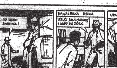
PROFLET W BURKIE