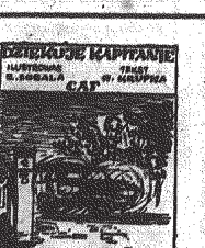
PROFLET W BURKIE

Organ KW PZPR w Kielcach. Władze państwa powinny zadbać o to, aby organ, który jest typowy dla naszego kraju, miał szansę na rozwój. W tym celu należy wyznaczyć odpowiednie miejsca i wybudować odpowiednie budynki.