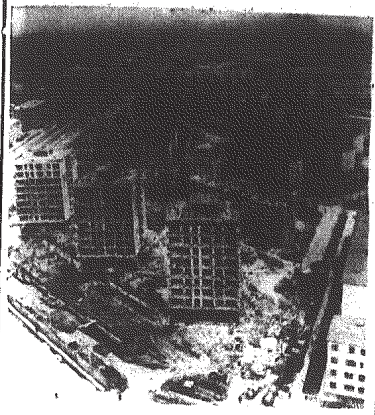
Katastrofalne trzęsienie ziemi w stolicy Uzbekkiej SRR w 1966 r. pozbawiło dachu nad głową kilkadziesiąt tysięcy rodzin...