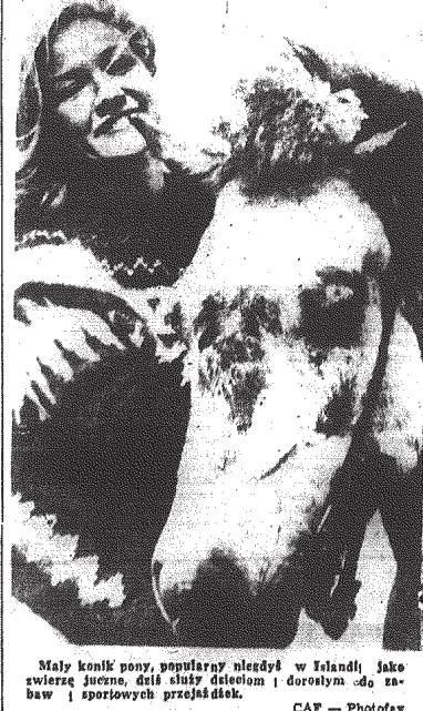
Maly konik popy, popularny niedźwiedź w Islandii. Jako zwierzę juższe, dziś służy dzieciom i dorosłym do zabaw i sportowych przejazdów.

wówczas drogą. Rybacy i kupcy stracili zdolność konkurowania z kolegami norweskimi czy brytyjskimi. Stanęło przed nimi widmo bankructwa, a przed państwem — perspektywa braku dewiz, bez których ambicje plany rozwoju gospodarczego nie mogą być realizowane. Rząd premiera Benediktssona zaczął szukać wyjścia z tej trudnej sytuacji. Rozważał możliwość przystąpienia Islandii do EWG, jednak wówczas Islandia faktycznie straciłaby niezależność ekonomiczną i musiałaby poważnie obniżyć cła importowe, co w pierwszym przynajmniej okresie zrównowoliby rodzimy przemysł. Szanse przystąpienia do EFTA też nie wyglądały różowo. Treba również obniżyć cła im portowe, co narzuca podobnych trudności, jak w przypadku EWG i pozwolił na zalanie rynku islandzkiego towarami o niższych cenach od cen