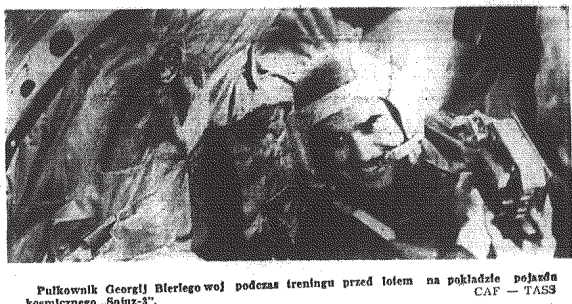
Bulkownik Georzi Bieriego w czasie treningu przed lotem na pokładzie samolotu kosmicznego „Sojuz-3”.

Wczoraj rano nad Szczecinem i wieloma rejonami Bałtyku Zachodniego przeszła niezwykła jak na porę rocznicowa burza połączona z ulewą i wyładowaniami atmosferycznymi. Jej przyczyną był ostatni dzień października, który w Szczecinie niezwykły - jak na porę roku - ciepły. Termometry wykazywały kilka nadcię stopy ciepła. W lasach urosła grzyby jesiennych.