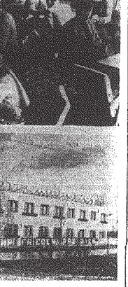
Jak już informowaliśmy, w Kielcach otwarto pierwszy w kraju nowoczesny hotel dla kierowców...