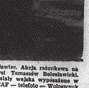
Po katastrofie w pow. Białostawca. Akcja ratunkowa na terenie zalanej przez wodę wsi Tomaszów Białostawski. W akcji tej biorą udział oddziały wojska wyposażone w sprzęt spręż.

LONDYN PAP. — W ub. dobie na krótko przed rozpoczęciem spektaklu wybuchł pożar w Lizbońskim teatrze Ave. Pożar całkowicie zniszczył teatr. Sola nie była ocalała. Na scenie nie było jeszcze przepalonych widowni, gdyby mogli opuścić salę.