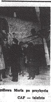
Król Grecji Konstantyn i królowa Maria po przybyciu na lotnisko w Rzymie, 14 bm.