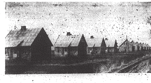
Prace budowlane w powiecie kieleckim.

Wytwarzanie własnego klimatu, sprzyjającego rozwojowi budownictwa wiejskiego, zależy będzie wszystkim od działalności rad narodowych oraz wszystkich jednostek gospodarczych i społecznych.