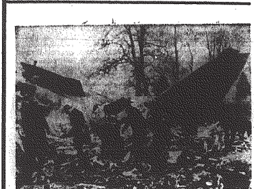
Na zdjęciu: ekipy ratownicze przeszukują szczątki samolotu.

Kontynuacja ona będzie badania, rozpoczęta przez stację „Wenus-4”, która w październiku 1967 roku łagodnie wylądowała na planecie Wenus.