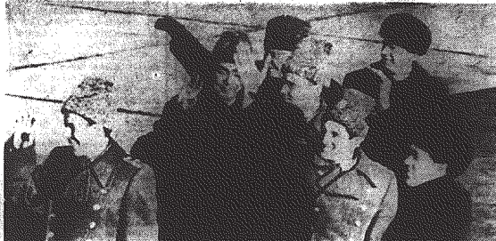
Kosmonauci przywitani są

Organ KW Polskiej Zjednoczonej Partii Robotniczej KIELCE, CZWARTEK, 23 STYCZNIA 1968 R.