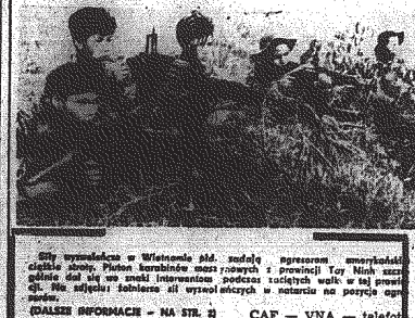
Wietnam. Wietnamscy żołnierze walczą z amerykańskimi w powietrzu...