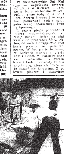
Członkowie kółka ZBOWiD przy pracy.