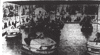
Dziesiątka młodych żołnierzy Wojska Polskiego...