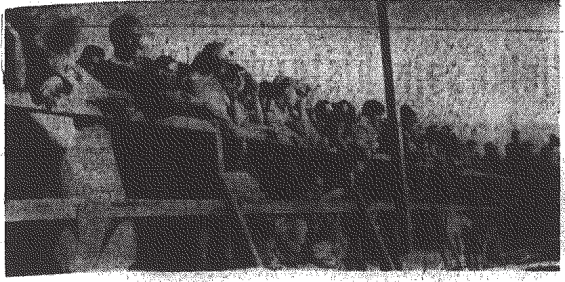
Tysiące turystów z zainteresowaniem obserwowali przebieg dymarkowego wypoju ślana.