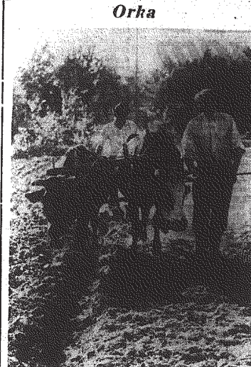
Do nowoczesności trudno to salceży, ale s rozmad-... wami może lepiej się opłacić, niż utrzymywanie kowia...