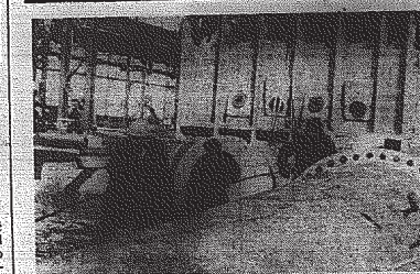
Stawianie kolima do piecek wytworzonego.

W I kwartale br. Oddział I. Emalieria Żelwa, "Kamiennej" w Skarżysku przekroczyła powalną, bo o 24 proc. produkcję pluczek na eksport do krajów kapitalistycznych. Wyprodukowano o 1010 sztuk więcej pluczek, niż w poprzednim kwartale. Wyroby wstąpiły zamówienie na 20 tln. pluczek, które do Libii z tej ilości ma dostarczyć w kwartale br. (2)