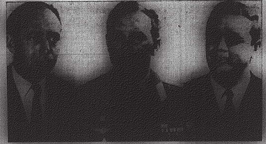
Radiocentry kosmonaut, którzy zginęli tragicznie podczas lotu statku kosmicznego „Sojuz-11” 30. bm. od lewej: W. Pacajew, G. Dobrowolski i W. Wołkow.

Georgij Dobrowolski, Władimir Wołkow i Wiktor Pacajew oddali swe życie jako pionierzy postępu, wnieśli doniosły wkład w dzieło opanowania kosmosu dla dobra całej ludzkości