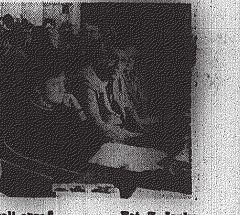
Fragment sali obrad.

Powołanie komisji rządowej do wyjaśnienia przyczyn śmierci kosmonautów MOSKWA PAP. EC KPZR i Rada Ministrów ZSRR postanowiły powołać komisję rządową do wyjaśnienia przyczyn śmierci kosmonautów GIEORGIIA DOBROWOLSKIEGO, WŁADIMIERA WOŁKOWA i WIKTORA PACAJEWA.