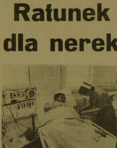
CAF — A. HAWALEJ