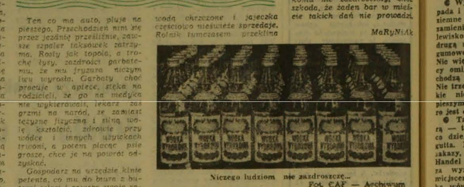
Niechaj ludzom nie zadroscie...