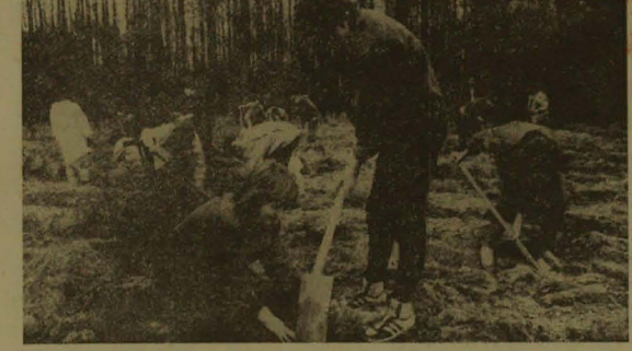
W odpowiedzi na apel OPZZ... Zalesianie w lasach...