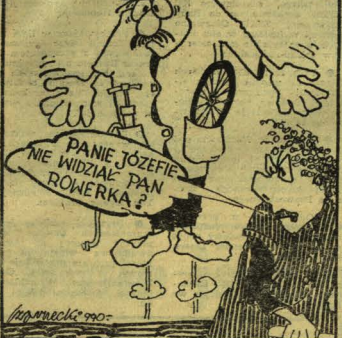
Rys. Tadeusz Czarnacki