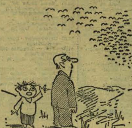
- CENNO ONIE NIE LEGA DO EUROPY ?