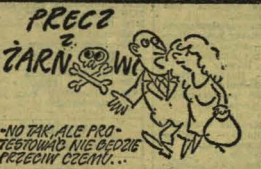
-NO TAK, ALE PRO-TESTOWANIE NIE BODZIE PRZEDWY CENNY...