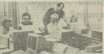
W Pracowni Komputerowej Fundacji Świątokrzyskiej w Modliszewicach. Kurs dla bezrobotnych.

KONSKIE. Z cenna niełatwo wyślubił konkencje Rejonowe Biuro Pracy. W modliszewickim Centrum Szkolenia Świątokrzyskiej Fundacji Roz-