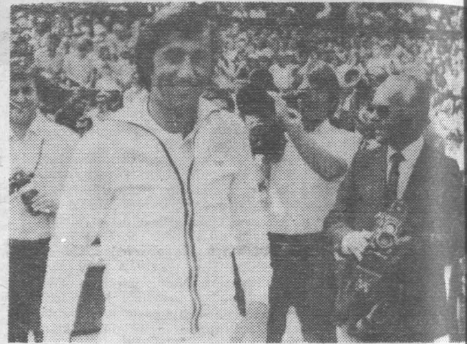
Jeden z najlepszych tenisistów na świecie, Rumun Ilie Năstăse, który aktualnie bierze udział w najważniejszej imprezie roku, w turnieju wimbledońskim rozgrywanym już po raz 87 na trawiastych kortach w Londynie.