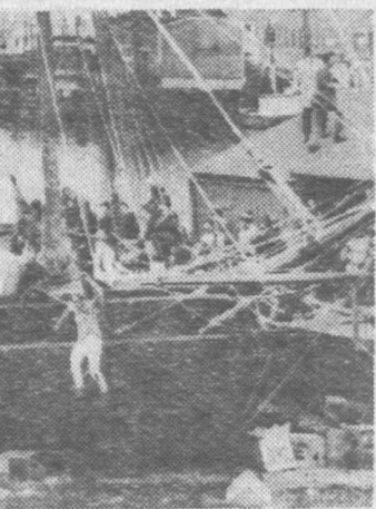
Setną rocznicę zajścia w Bostonie, 16 bm. w porcie powtórzone całe wydarzenie na pokładzie dokładnej kopii zagłowca.