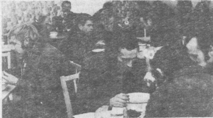
Stołówka w Wiśniówce wydaje obecnie smaczne i treściwe zupy.