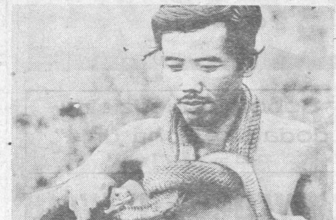
Wieżniak syjamski z nieszkodliwą kobra

Jeżeli w domu są dzieci, to przygotowanie ozdób choinkowych należy powierzyć im.