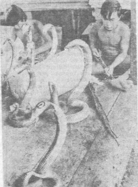
Tak odbywa się wypychanie wężów, które masowo wykupują turyści.

Syjam jest pod każdym względem krajem kontrastów. Oto np. na 514 tys. kilometrów kwadratowych zamieszkuje tylko około 34 mln mieszkańców.