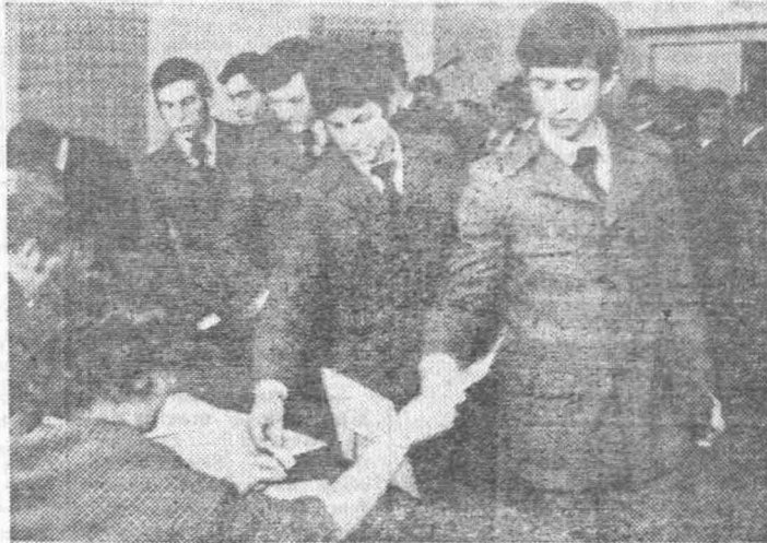
Przy ul. Wróblej w Kielcach zespołowo głosowali Junacy z OHP nr 143.