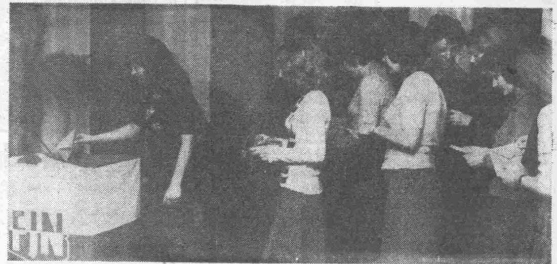
Głoszą radomskie studentki