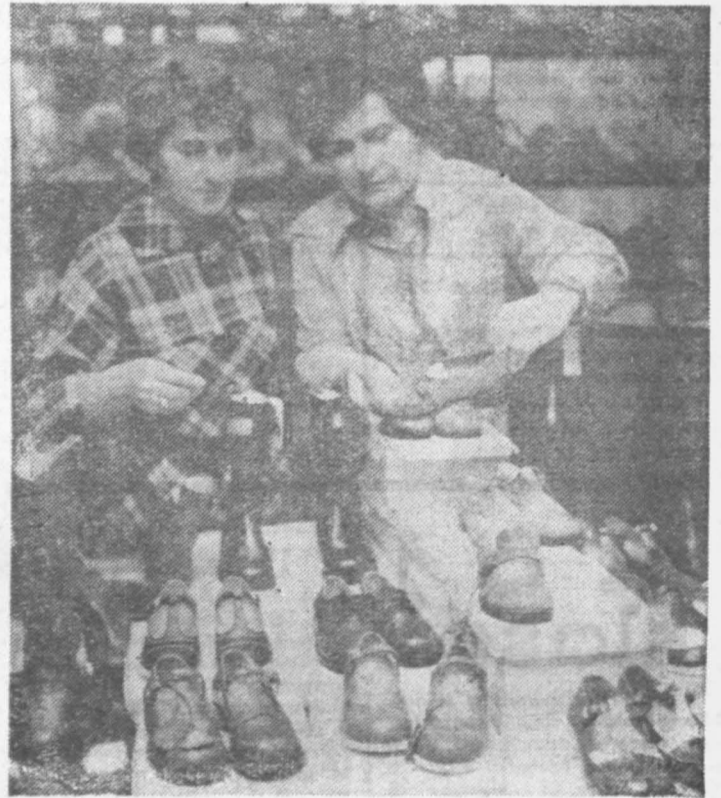
Nowa kolekcja „Radoskóru”.

Nie tylko wydatny wzrost produkcji, drogą mechanizacji i automatyzacji procesów odlewniczych, a zwłaszcza przyspieszenia montażu najnowocześniejszych automatów, ale także sprawy związanej z tym nową produkcją grzejników aluminiowych były przedmiotem obrad KSR w Odlewniach Radomskich. Jeszcze w br. nastąpi rozruch warunkujących postęp w radomskim odlewnictwie nowoczesnych urządzeń.