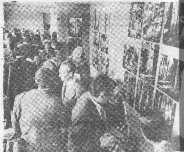
Otwarcie galerii ZPAF