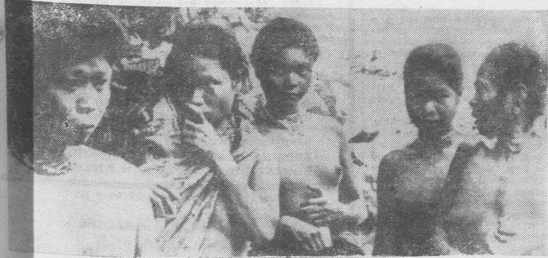
Grupa kobiet z odkrytego niedawno plemienia ludzi jaskiniowych żyjących w kraterze wygasłego wulkanu w dżungli na jednej z wysp na Filipinach.

Marian R. zamieszkały w Kielcach ul. Urzędnicza 9A m.15: Od trzech lat, czyli od momentu oddania bloku do użytku są w moim mieszkaniu DOKONCZENIE NA STR. 3