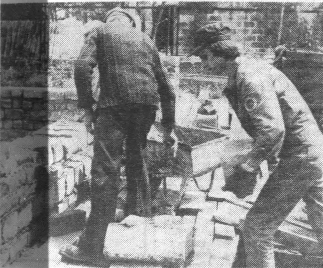
Wakacyjne hufce OHP na budowie ośrodka zdrowia w Sandomierzu.