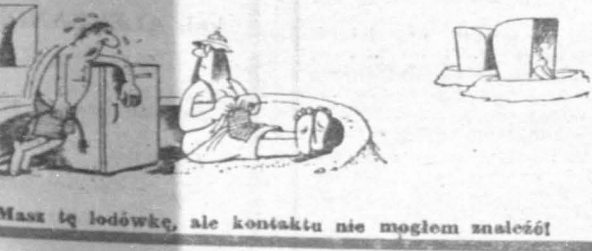
Masz tę łódzkę, ale kontaktu nie mogłem znaleźć!