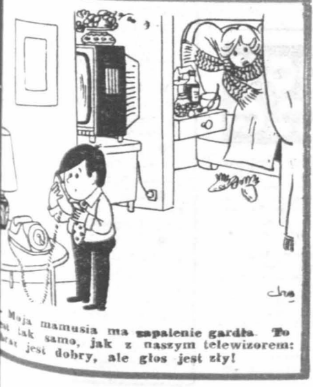
Moja mamusia ma zapalenie gardła. To jest tak samo, jak z naszym telewizorem: obraz jest dobry, ale głos jest zły!

Wielkopolskim amfiteatrze w Wągrowcu odbędzie się 10 czerwca koncert jubileuszowy z okazji 150-lecia Piosenki Radzieckiej. W programie — występ 27 soli-