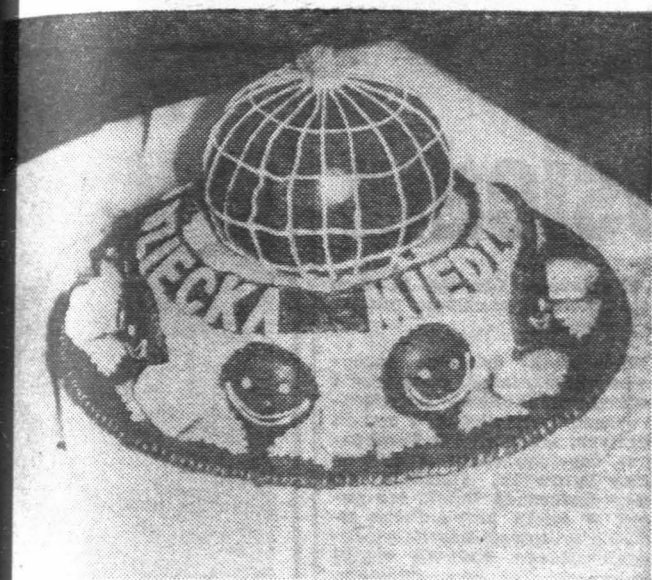
Najpiękniejszy — wybrany przez dzieci — tort dla milusińskich przygotowany przez cukierników z kieleckiego Oddziału WSS.

W KM MO Kielce, znajduje się znaleziony rower marki „Wigry-3” (składak). Właściciel roweru proszony jest o zgłoszenie się po jego odbiór do KM MO Kielce, ul. Wesola 45 p. 2, w godz. 14—16 — dzielnicowy Sokolowski.