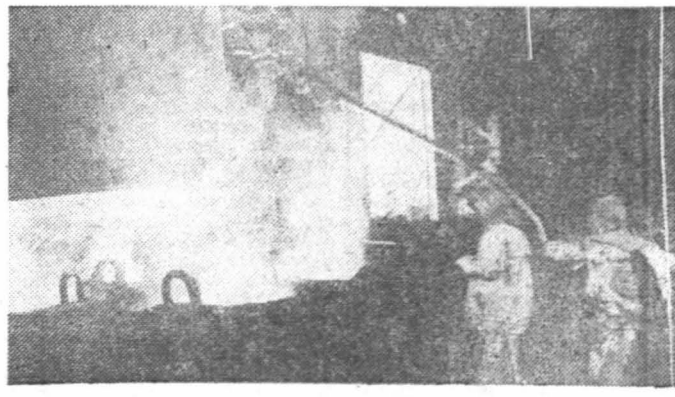
Najbardziej gorące wydziały w przemyśle to m.in. odlewnie. Na zdjęciu: odlewnia huty w Ostrowcu.