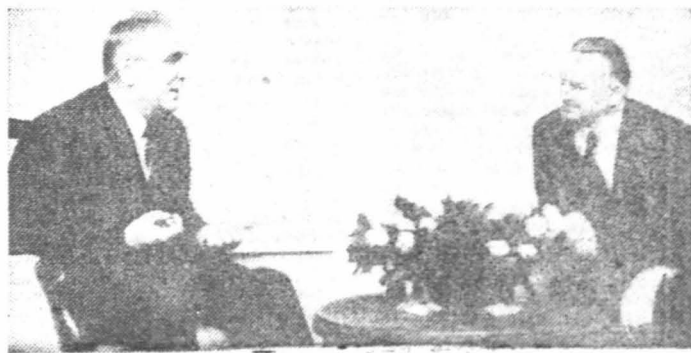
Podczas odwiedzin.

— W kolejnych okresach zmie- nia się po trosze, co przys- DOKOŃCZENIE NA STR. 2