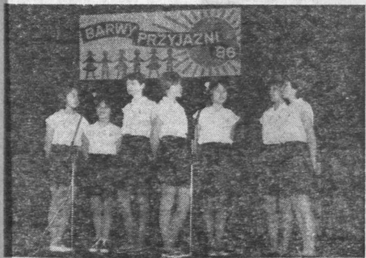
Na zdjęciu: zespół wokalne-taneczny ze Szkoły Podstawowej nr 9 w Starachowicach.

Jak więc widać z podanych przykładów, zaopatrzenie w zakładzie pracy, jest dość dobre, choć mogłoby być bardziej urozmaicone. W sprawie tej były interwencje służb socjalnych i związków zawodowych. Jak dotychczas, bez większych efektów... (J. Ryb.)