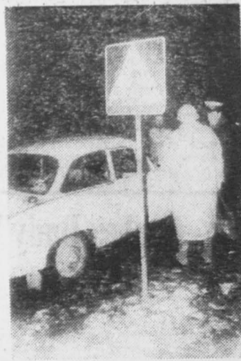
Kierowca tej „syrenki” jako miejsce do parkowania wybrał sobie przejście dla pieszych.