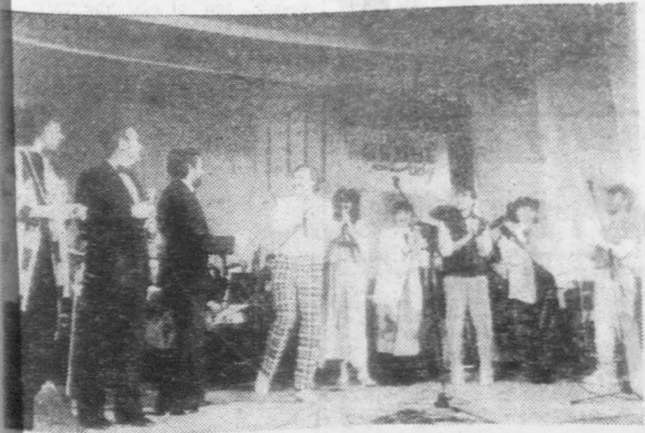
Gwiazdy Studia Lata na kieleckiej estradzie.