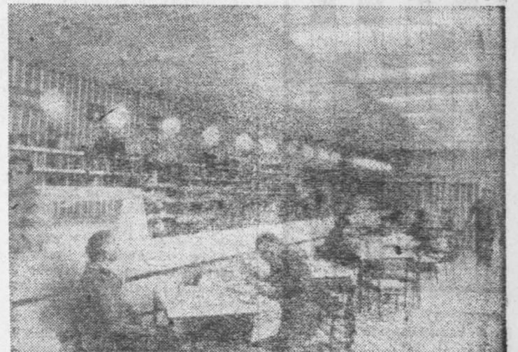
Tu można zjeść dobrze, przyjemnie i w miarę tanio.

Mieści się tu restauracja, kawiarnia, cocktail-bar oraz szybkiej obsługi, który szcze-