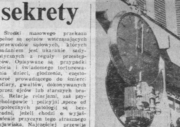
Nowa moda w Japonii - zegary z pozytywką. Co godziną zabawne figurki wygrywiają przyjemne dla ucha melodie.