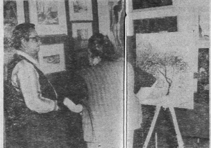
Spotkania malarzy na plenerze są okazją do wymiany doświadczeń...