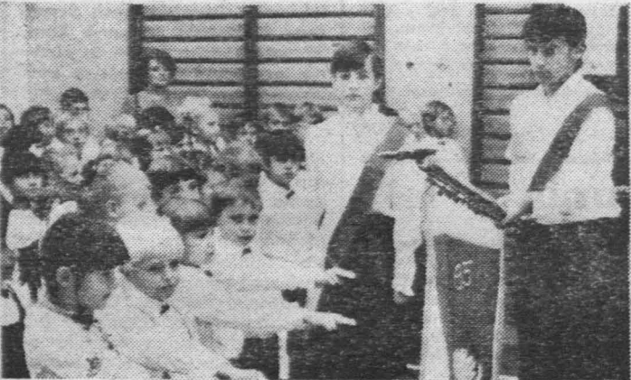
Przedstawiciele poszczególnych klas pierwszych składają ślubowanie na sztandar szkoły.