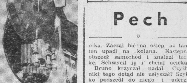
Nowa moda w Japonii - zegary z pozytywką. Co godziną zabawne figurki wygrywiają przyjemne dla ucha melodie.