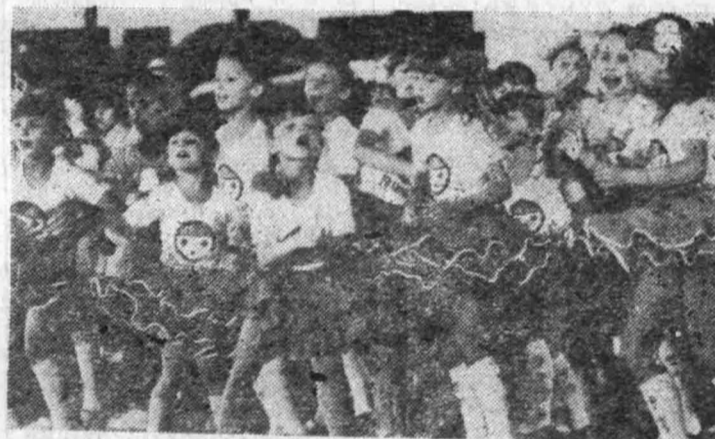
Tak tańczyły „Pędziwiasty” z Łodzi.