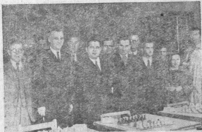
Grupa szachistów ZS. Budowlani biorących obecnie udział w rozgrywkach o mistrzostwa klasy C. woj. kieleckiego