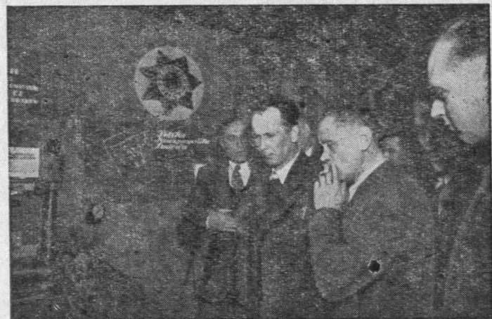
Grupa racjonalizatorów w pawilonie wystawowym