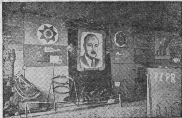
Fragment wystawy wynalazczości ZIS BM w Radomiu

Najwyższy czas, aby Rada Oddziałowa przy KOR w Kielcach zajęła się tą sprawą, gdyż jak się dowiadujemy pieniądze na zakup takich podstawowych urządzeń jak stoliki, krzesła, radio są w dyspozycji Rady.