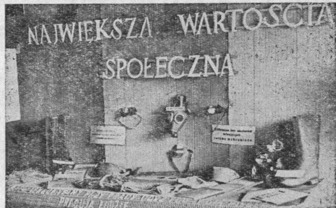
Stoisko Bezpieczeństwa i Higieny Pracy