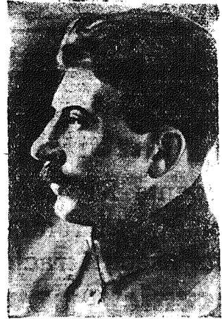
Współ z Leninem Stalin prowadził walkę przeciwko Kamieniewowi, Zinowjewowi, Rykowowi i innym lamistrajkom i dezertierom rewolucji. Stalin bierze aktywny i kierowniczy udział w rozgromieniu Kierieńskiego — Krasnowa, złamaniu sabotażu urzędników, zlikwidowaniu kontrrewolucyjnej Kwatery Głównej, oraz carskiej generacji, w zamknięciu prasy burżuazyjnej, w walce przeciwko kontrrewolucyjnej Radzie Ukraińskiej, w rozgromieniu burżuazyjnego Zgromadzenia Ustawodawczego, w opracowaniu pierwszej Konstytucji Radzieckiej 1918 r. i w organizowaniu Komunistycznej Międzynarodówki.

Obaleni przez rewolucję kapitaliści i obszarnicy Rosji łącznie z kapitalistami innych krajów rozpoczęli walkę przeciwko Krajowi Rad.