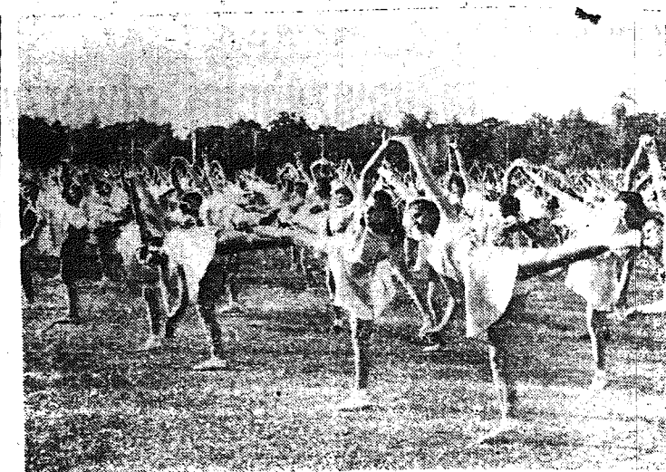
Podczas Wielkiego Ludowego Festynu Pokoju odbyły się na stadionie AWF pokazy gimnastyki i tańców zbiorowych. Na zdjęciu: popis uczennic warszawskich szkół zawodowych.

PRAGA. W poniedziałek zostały zakończone w Pradze międzynarodowe mistrzostwa tenisowe Czechosłowacji. W półfinale gry mieszanej para węgierska Asboth, Koermoeecy pokonała małż. Solc 6:1, 6:2. Następnie rozegrało spotkanie pokazowe Radzka - Sikroky 3:6, 7:5, poczem Asboth i Koermoeecy rozegrali finał z parą czechosłowacką Javorsky, Miskova. Zwyciężyła para węgierska 9:7, 6:2. W finale gry podwójnej Zabrodsky i Kunstfeld pokonali łatwo Krejčika i Javorsky'ego 8:8, 6:2. Teniści polscy przed powrotem do kraju rozegrają jeszcze spotkanie pokazowe w Gottwaldowie i Ostrawie, a Węgrzy w Bratislavie.