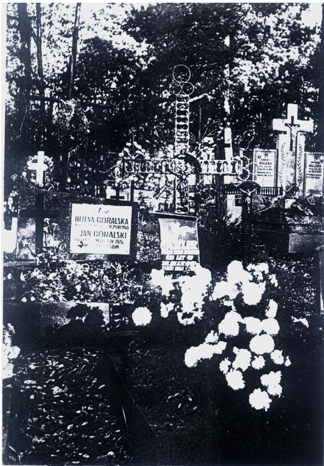
Grób Jana Gajzlera na cmentarzu parafialnym w Suchedniowie