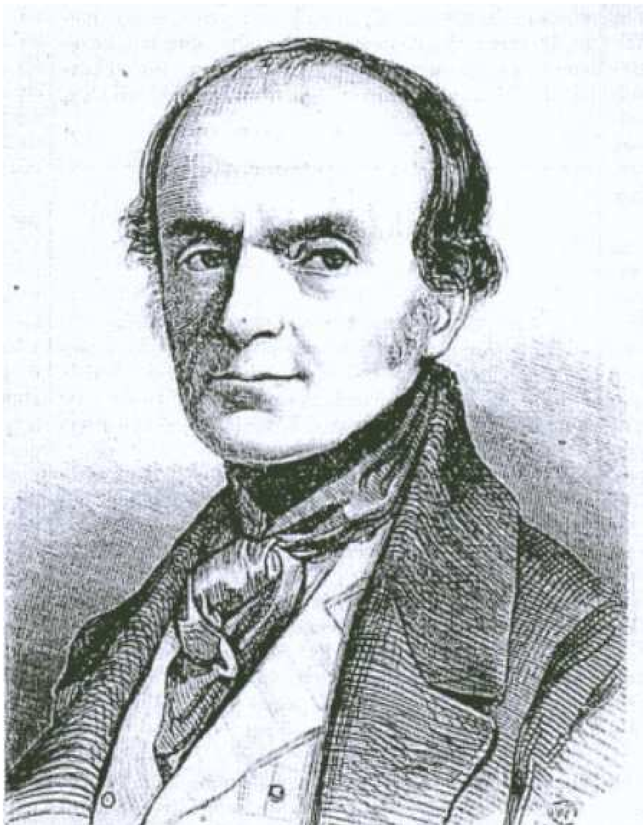
2. Józef Gołuchowski (Rysował W. Gerson, rytował H. Röber), Tygodnik Ilustrowany 1860, nr 20, s. 161.