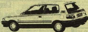
Corolla 1.3 XL Hatchback