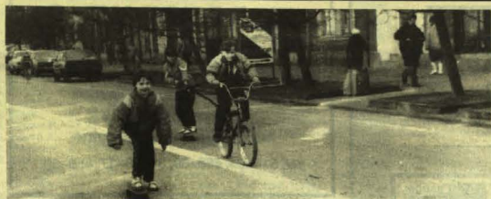
Rowerowa jazda z trykanką