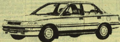
Corolla 1.3 XL Sedan