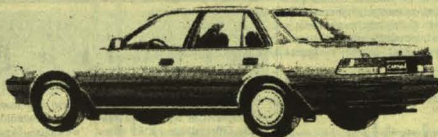
Carina 1.6i XL Sedan