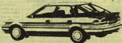
Corolla 1.6i XL Liftback