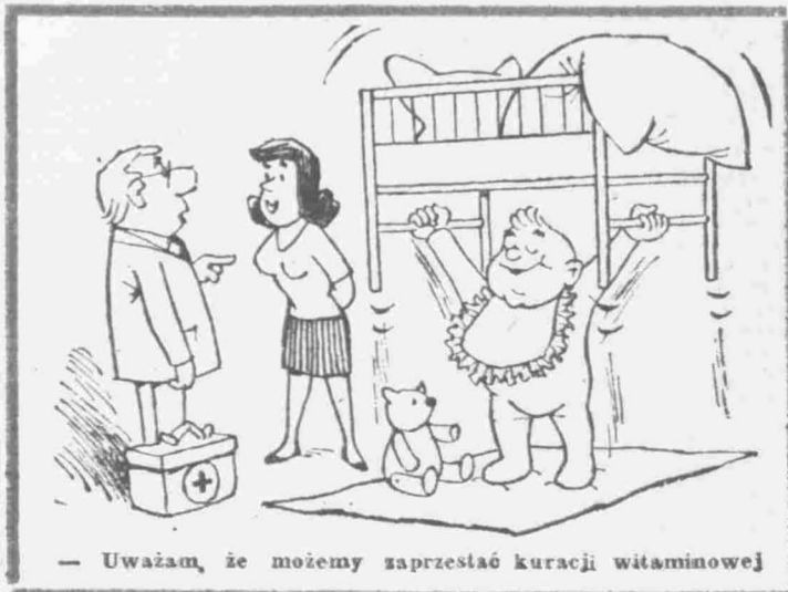
— Uważam, że możemy zaprzestać kuracji witaminowej