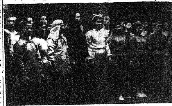
Zespół artystów cyrku chińskiego na chwilę przed występem w sali Domu Młodzieży w Kielcach.

W środę, dnia 7. III. br. odbył się w sali Domu Młodzieży w Kielcach występ reprezentacyjnego zespołu cyrkowego Chińskiej Republiki Ludowej, który po występach w Warszawie