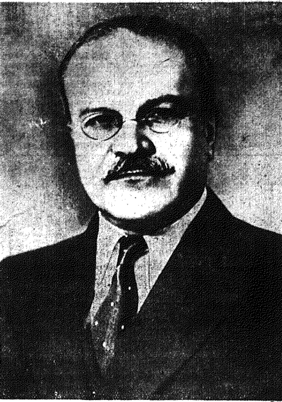
W dniu dzisiejszym mija 61 rocznica urodzin niezłomnego rewolucjonisty, zasłużonego działacza państwowego ZSRR — Wiaczesława Mołotowa.

Tow. Mołotow — wierny towarzysz broni Lenina i Stalina — całe swe życie poświęcił walce o sprawę klasy robotniczej, o zwycięstwo socjalizmu i pokoju.