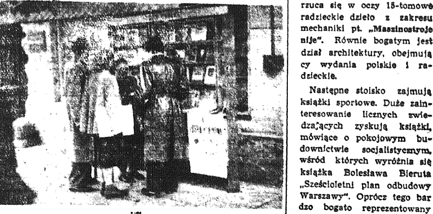
Stoiska „Domu Książki” cieszą się uznaniem mieszkańców Radomia, którzy na loterii książkowej próbują szczęścia, aż do skutku. Na zdjęciu: moment „ciągnięcia” na loterii książkowej przy ul. Zeromskiego.