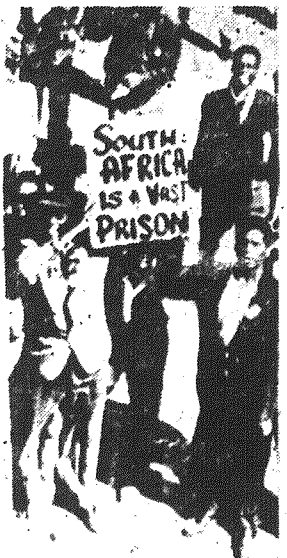
Na zdjęciu: Fragment demonstracji młodzieży pracującej Afryki Południowej przeciw faszyzowskiemu terrorowi rządu Malana. Na transparentie napis: „Afryka Południowa jest olbrzymim więzieniem”.