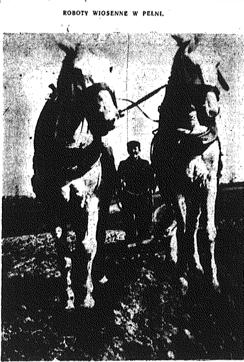
Chłopi przystąpili do orki, włókania, stęwo.

Każdy dzień przynosi systematyczną poprawę warunków bytowych ludzi pracy. Powstają nowe bloki mieszkalne, oddawane są do użytku ludzi pracy nowe placówki służby zdrowia, obiekty socjalne.